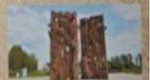
Тростенец. 546 тыс. погиб.

Самым крупным на Минщине было Слуцкое гетто. Здесь уничтожено 8 тыс. человек.