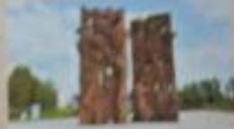
Тростенец, 546 тыс. погиб

Самым крупным на Минщине было Слуцкое гетто. Здесь уничтожено 18 тыс. человек.